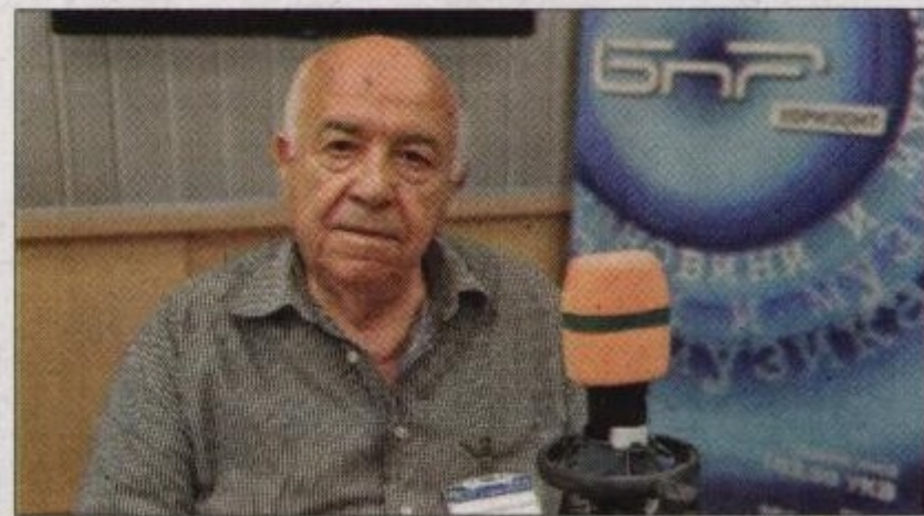
Гост в БНР

- Избягвам генерализациите, които могат да са подвеждащи. Има разлики и прили-