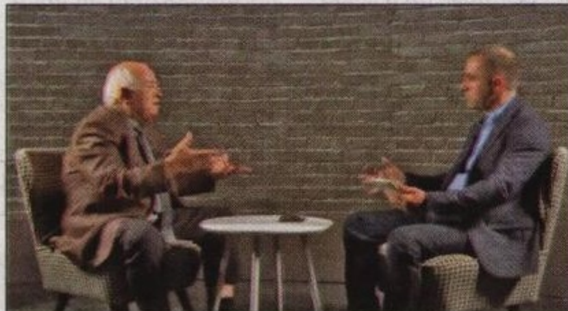
В предаване по NOVA

- Християнската култура на взаимоотношенията какво ни показва напоследък,